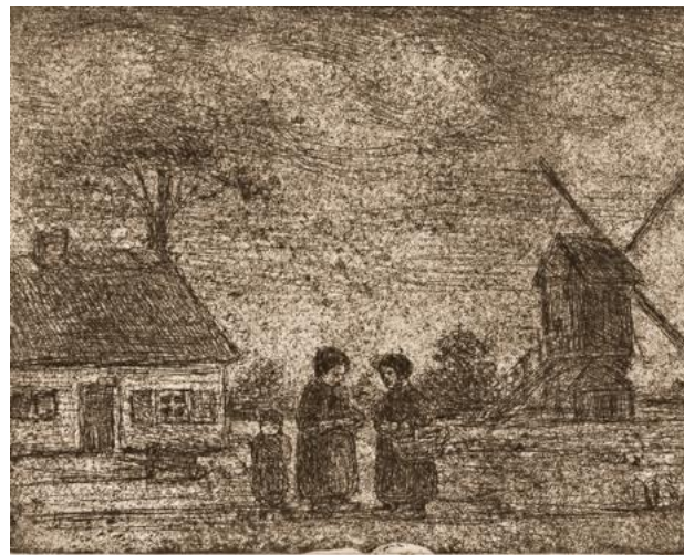
Bij het vallen van de nacht. © Jakob Smits

Om den brode begon hij daarom grafiek te maken. Mono toont een kleine selectie prenten en schilderijen van Smits en trekt van daaruit fijne lijntjes naar werken van een handvol van zijn tijdgenoten en een groter aantal hedendaagse kunstenaars. Liekens ging daarbij vooral op zoek naar kunstenaars die de prentkunst niet puur bekijken als een middel om werk te reproduceren, maar die het medium op een bepaalde manier heruitvinden en er unieke kunstwerken mee maken, zoals hij